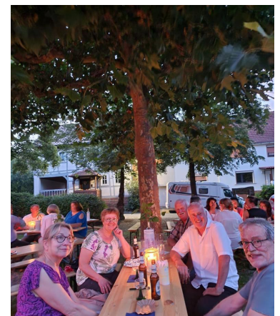
Gemütlichkeit unter der Platane

Am 19. August wurden alle Schwabendorfer und Freunde zum Fest unter der Platane eingeladen, ein paar mehr Besucher hätten es sein können, dennoch genossen alle Anwesenden das einmalige Ambiente auf dem Hugenottenplatz und fühlten sich wohl bei Käse und Wein, Gegrilltem und frisch Gezapftem. Vielen Dank an alle Helfer aus den Reihen des Arbeitskreises und darüber hinaus, die diese Veranstaltung unterstützten.