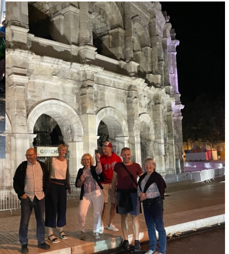
Nachts in den Straßen von Nîmes