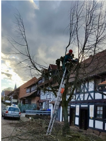
Henning Kaiser in der Lindenkron

Die Masken fallen! Ab dem 8. April fallen alle Corona Einschränkungen und wir können mit dem 49 Euro Ticket durch ganz Deutschland reisen. Wir empfangen nahezu 240 Besucher an neun Öffnungstagen.