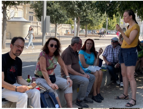
Picknick in Avignon